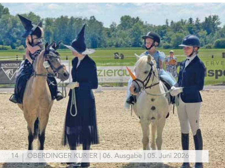
Die Führzügelklasse sorgt mit kreativen Kostümen wie Elsa und Olaf für besondere Momente. Auch als Harry Potter und Goldener Schnatz treten junge Teilnehmerinnen und Teilnehmer in der Führzügelklasse auf.

Neben den hochklassigen Dressurprüfungen begeisterte auch der Führzügel-Wettbewerb mit kreativen Kostümen die Zuschauer. Rund fünf Kinder ritten