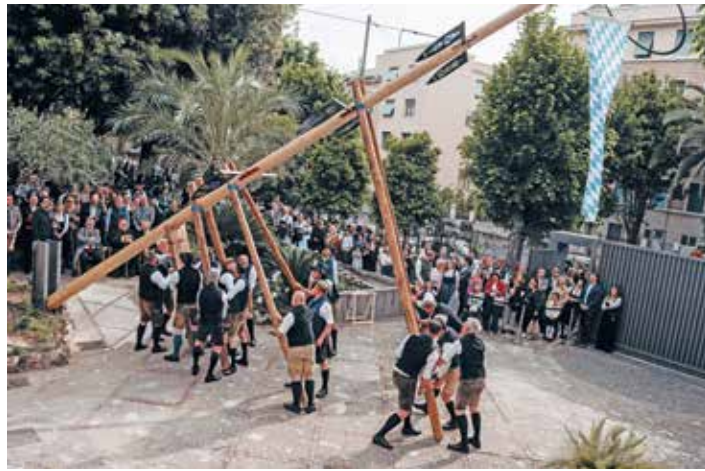
Auch in Rom wird der Maibaum aus Schwaig traditionsgemäß mit Muskelkraft und Schwalben aufgestellt