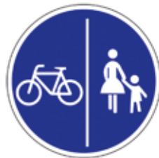
VZ 241: getrennter Geh- und Radweg

Separate Radwege sind in Fahrtrichtung mit folgendem Schild gekennzeichnet: