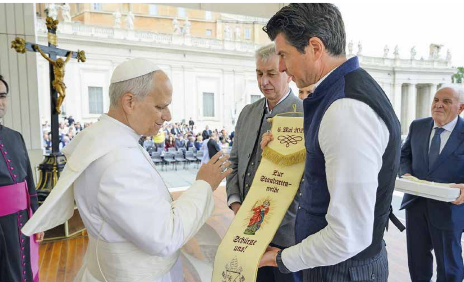
Päpstlicher Segen für das Fahnenband

W ie die ganze Geschichte begann, ist bekannt. Ein kurzer Rückblick: Kardinal Reinhard Marx stiftete einen Maibaum für das Begegnungszentrum Casa Santa