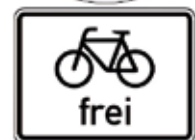
VZ 239: Gehweg, Zusatz: „Fahrrad frei“

Insbesondere bei Konfliktpotenzial zwischen Fahrrädern und Fußgängern ist es sinnvoll, dass hier die Benutzungspflicht für Fahrräder entfällt.