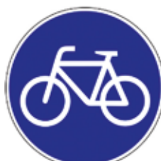
VZ 237: Radweg

Separate Radwege sind in Fahrtrichtung mit folgendem Schild gekennzeichnet: