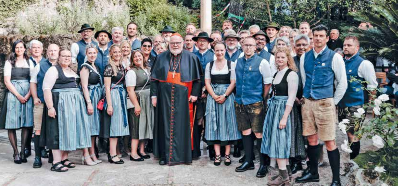
Die Moosmotor-Reisegruppe und Kardinal Reinhard Marx

Auf der Reise nach Süden fiel der echte Baum zwar ebenfalls unter die Räuber, aber Berichten zufolge wollten die Mitglieder des Trachtenvereins „Alpenrose“ Nussdorf mit einem Film über den Raub des „begehrtesten Maibaums Bayern“ für ihr Gaufest werben. Beim Moosmotor war man allerdings der Meinung, dass man in diesem Fall nicht von einem Maibaumdiebstahl sprechen kann, denn offensichtlich waren Mitglieder des Vereins bei der Spedition beschäftigt und nutzen ihr Insiderwissen.